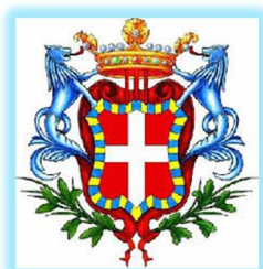
CITTA' DI MONCALIERI