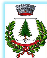
COMUNE DI PECETTO TO.SE